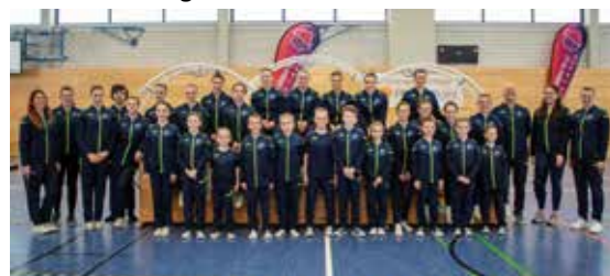
Das gesamte Wettkampfteam der Rhönrادتornturnerinnen und Turner